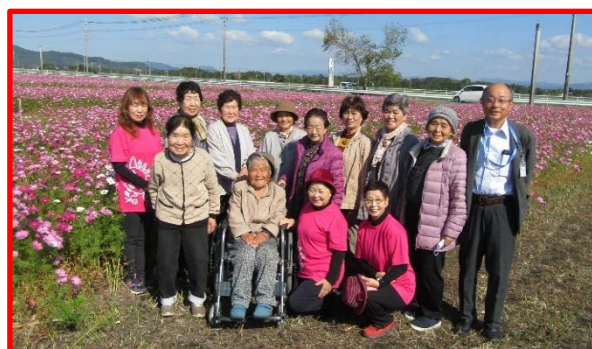
11月の研修視察（志布志市コスモスロード）