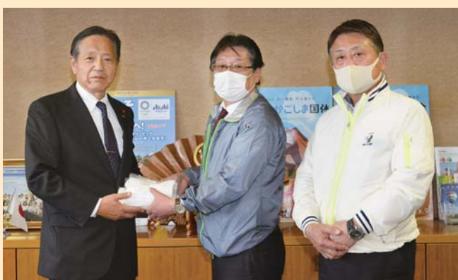
▲ かのや大黒グランドホテル(共栄町)が、市内の医療機関や公共施設等へマスク1万5千枚を寄贈しました。同ホテルは、1週間ほどかけて各施設を訪問してマスクを配布しました。