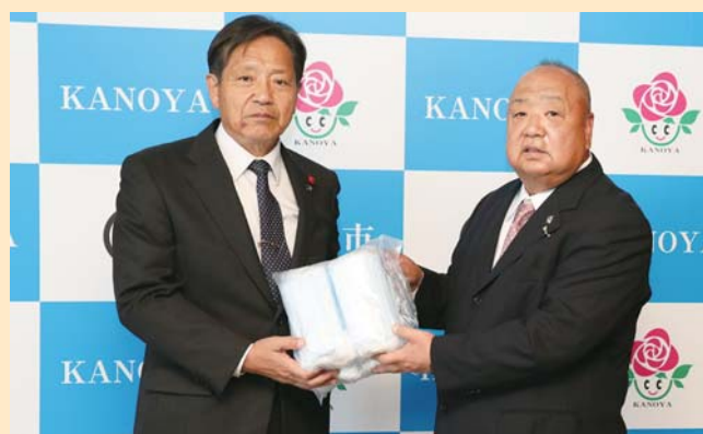
▲ 4月27日、鹿屋西ロータリークラブから、マスク2万枚の寄贈をいただきました。いただいたマスクは、鹿屋市歯科医師会や鹿屋市薬剤師会、市内の妊婦の方などへ配布します。