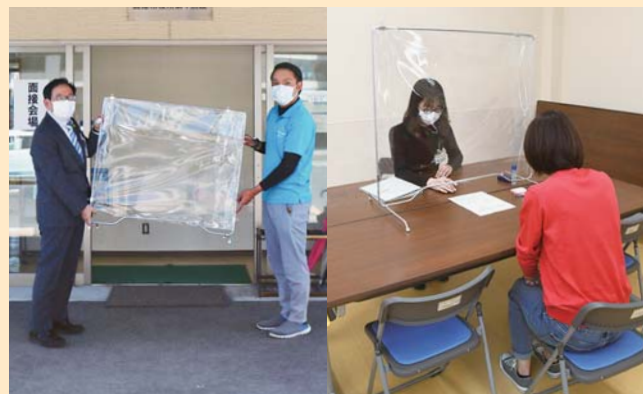
▲ 4月30日、有限会社アリドメ(札元1丁目)から飛沫感染予防シールド5台の寄贈をいただきました。いただいたシールドは特別定額給付金の相談窓口を設置しました。