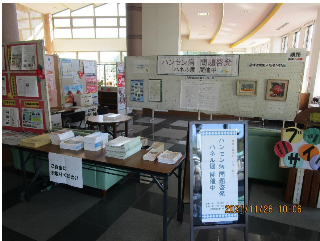
串良ふれあいセンター