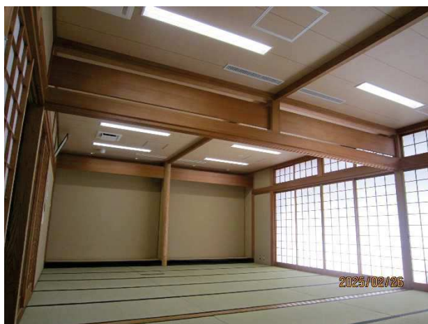
和室のLED・天井・畳

以下に、主な改修工事箇所を紹介します。ご来館の際は、電気・空調設備のスイッチなどをご確認いただき、有効利用及び節電等にご協力ください。よろしくお願いいたします。