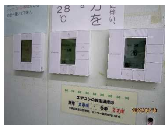
図書室の エアコンパネル