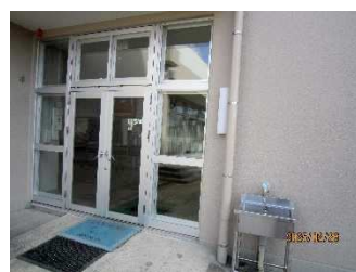
中庭側入口の ドア類と手洗い場