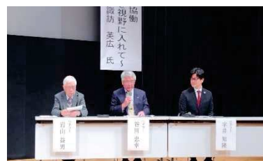
【パネルディスカッション】

最後の講演を含め、今後の寺子屋活動を進める上でいろいろと参考になるシンポジウムでした。指導員の方々をはじめ、出席してくださった皆様、お忙しい中ありがとうございました。今後も鹿屋寺子屋事業へのご参加・ご協力をよろしくお願いいたします。保護者の方々には、お子さんの来年度の寺子屋への参加について検討していただき、引き続き及び新規の参加をお願いいたします。お待ちしております。