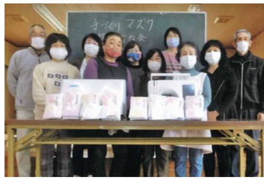
地域の高齢者に 手作りマスクを配布

5月21日～23日、肝属中央家畜市場で、牛肉の消費拡大運動が行われました。これは、新型コロナウイルス感染症の影響で落ち込む牛肉の消費拡大のために、せり市に参加した和牛繁殖農家が、売却した子牛1頭当たり2,000円の牛肉を購入するもの。3日間で約1,200頭がせり市に出品され、約250kgの牛肉の消費につながりました。