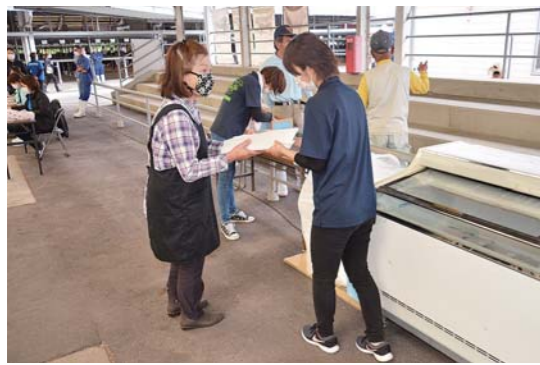
生産者同士で助け合う 牛肉の消費拡大運動

5月21日～23日、肝属中央家畜市場で、牛肉の消費拡大運動が行われました。これは、新型コロナウイルス感染症の影響で落ち込む牛肉の消費拡大のために、せり市に参加した和牛繁殖農家が、売却した子牛1頭当たり2,000円の牛肉を購入するもの。3日間で約1,200頭がせり市に出品され、約250kgの牛肉の消費につながりました。