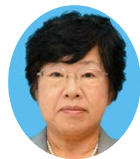
柴立 豊子 議員 (日本共産党)