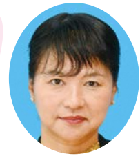
米永 淳子 議員 (社会民主党)