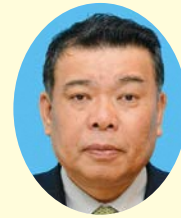
議長 花牟礼 薫