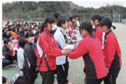
「ばらのまち鹿屋」 高校ソフトテニス九州大会 の様子