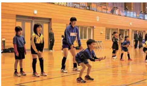
バレーボール教室の様子

鹿 屋市バレーボール協会は、鹿屋市はもとより肝属地区バレーボール発展のために、各種大会や講習会を開催し指導普及に取り組んでいます。