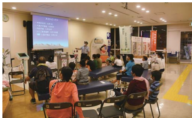
▲観測会の前に観測する星の説明をすることもあります。