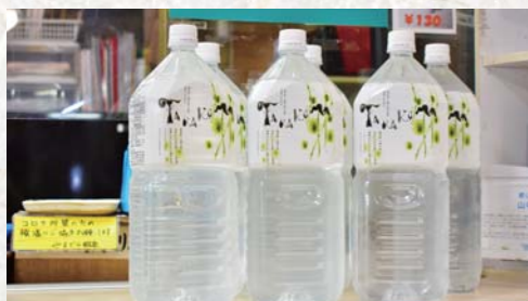
▲ミネラル成分をたっぷり含んだ山寺鉱泉の水は、受付で購入可能(280円/2L)。鉱泉水を沸かして切り傷の患部に浸すと、治癒効果もあります。