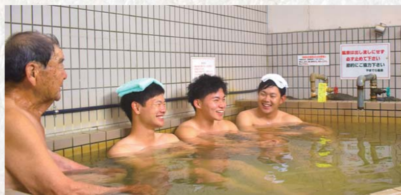
▲常連のお客さんと肩を並べて、楽しいひと時を過ごしました。

源泉かけ流しでアンチエイジングにも効果大 北田交差点から国道504号線を北上し、上祓川町の一角に山寺鉱泉浴場があります。キャッチフレーズは「癒しの森林浴ができる静かな湯治場」。鎌倉時代から使われてきたとされる源泉を高隈山一合目から2kmかけて引き、昭和41年に開業されました。 その泉質は、肩こりや神経痛、切り傷に効果があるナトリウム、カルシウムイオンなど10種類の成分を含んだ単純泉。また鉱泉の中に多量に含まれるサルフェートは、アンチエイジング効果が期待でき、肌がつるつるになります。