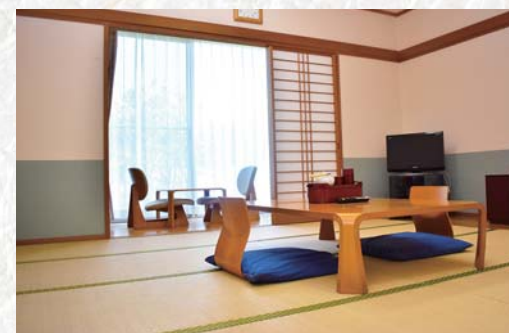
▲6人まで宿泊できる和室。その他2人部屋の洋室など合計13部屋有ります。