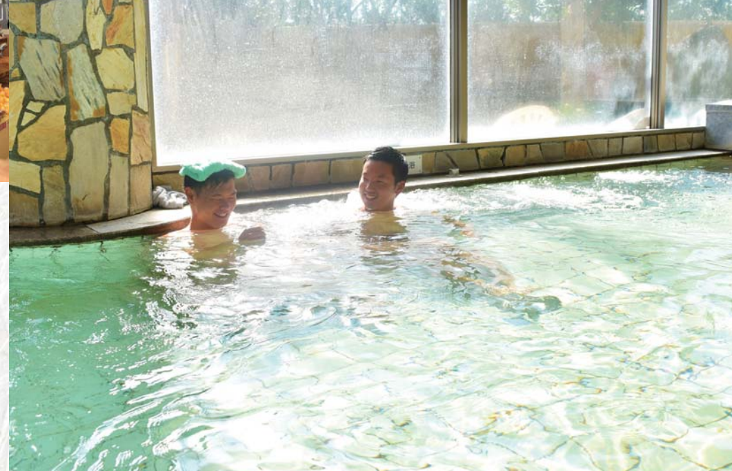
▲大浴場は和風と洋風の2種類があり、交替わりで楽しめます。一部の浴槽には準天然温泉のトゴール湯を使用し、筋肉や関節痛の緩和に効果があります。