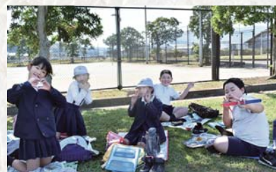
▲下名小学校3年生の児童29人が社会科見学の昼休憩で多目的グラウンドを使用しました。

スタッフの元気が良く、地域の皆様とのコミュニケーションが活発で、交流拠点になっていると思います。毎日来られる常連さんから、週末は子連れのお客さままでいつもにぎわっています。お客様から「明日も来るね」と言われることも多く、毎日元気をいただいています。県外から宿泊に来られる方もおり、閑静な立地環境や地元産の食材を用いた食事、ゆったりとしたお風呂にとっても満足いただいております。