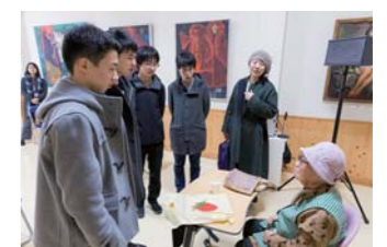
星塚敬愛園への訪問(本郷中学校・本郷高等学校)