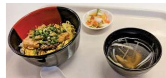
鹿屋産カンパチ等を使った学食(湘南学園)

かのや100チャレに第1回から参加している学校もあり、これまで鹿屋市への訪問や特産品の販売、学園祭等での鹿屋市のPRなど、様々な波及効果が生まれています。