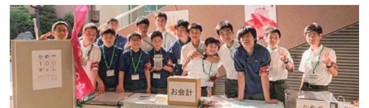
東京私立男子中学校フェスタでの鹿屋ブース(京華中学・高等学校)