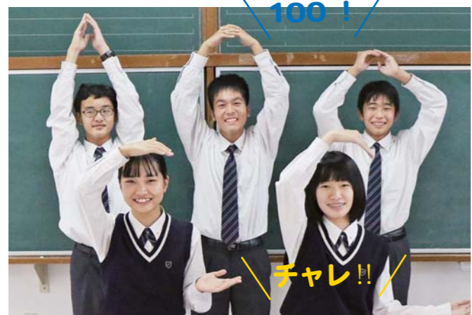
串良商業高等学校

課題研究の授業で、この課題に挑戦しました。10月にコンテストへの参加を決めてから、インターネットを使って様々なことを調べ、人に来てもらえるまちづくりをテーマに想像を膨らませながら、みんなで考えてみました。戦跡というテーマは非常に難しかったですが精一杯頑張りましたので、私たちの発表内容をぜひご覧ください。