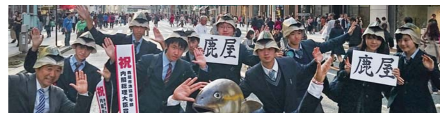
カンパチジャック in TOKYO への参加(参加校)