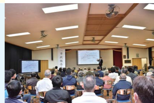
▲ 11月25日 輝北会場 (百引校区公民館)

多くの方にご来場いただきました 市政報告会は鹿屋会場のほか串良・吾平・輝北の計4か所で開催し、多くの市民の皆様にご来場いただきました。 鹿屋市を取り巻く現状や課題、政策の進捗状況について、市長がスライドを用いて約2時間にわたり説明を行いました。来場者は、真剣な眼差しで時折うなずきながら、説明に聞き入っていました。 また今回、不特定多数の人が発言することによる飛沫感染を防ぐため、説明後の質疑応答を割愛し、アンケートにより質問を受け付けました。質問に関する回答は、市ホームページに掲載していますのでご確認ください。