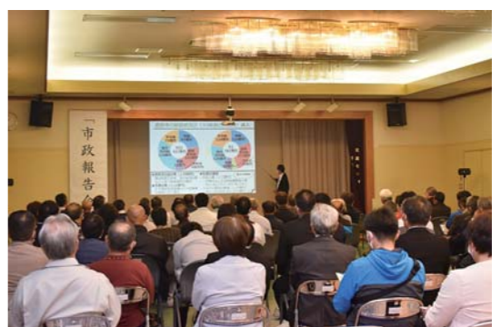
▲ 11月20日 吾平会場 (湯遊ランドあいら)