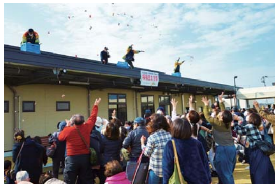
「豆まき」で コロナ収束を祈願

2月2日、アグリパークかのやで「豆まき」が行われました。これは、JA鹿児島きもつきが組合員や地域住民に対し、安心安全な地元産の食材で免疫力を高めてもらい、地域を元気づけようと実施したものです。この日は、福豆2,000袋が準備され、中には農畜産物が当たる袋も混じっており、「鬼は外、コロナも外」という力強い掛け声とともにまかれました。