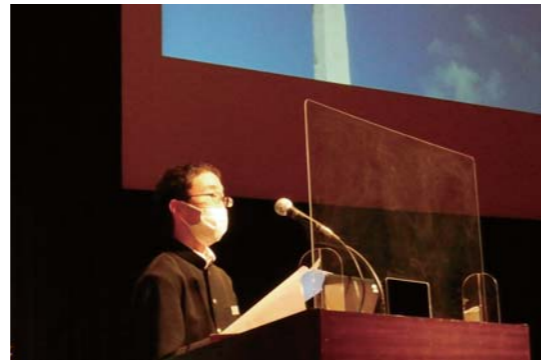
学校力向上を目指し 取り組みを共有

2月14日から、かのやばら園フラワーマーチ2021「寄せ植え発表会」が開催されています。これは個人で作った寄せ植えを募集し、園内に展示するイベント。パンジー、ピオラ、ランキュラスなどの色鮮やかな寄せ植えが展示され、来園者を楽しませています。このイベントは3月28日(日)まで行われます。