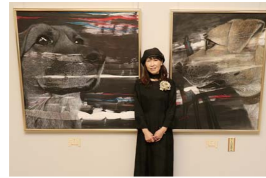
「市美術展」に多彩な 作品が集結

2月5日、リナシティかのやで「令和2年度学校教育実践発表会」が開催されました。これは学校や教職員の取り組みを公開することで、よりよい教育につなげることを目的に毎年行われているもの。会では、教職員による各学校の取り組みや生徒による英語弁論の発表、平和へのメッセージの朗読などが行われ、参加者は熱心に耳を傾けていました。