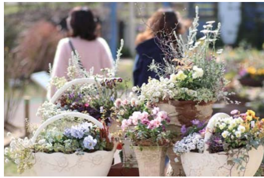
色とりどりの花の 組み合わせを楽しむ

2月14日から、かのやばら園フラワーマーチ2021「寄せ植え発表会」が開催されています。これは個人で作った寄せ植えを募集し、園内に展示するイベント。パンジー、ピオラ、ランキュラスなどの色鮮やかな寄せ植えが展示され、来園者を楽しませています。このイベントは3月28日(日)まで行われます。