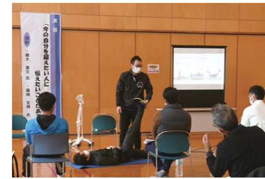
より効率よく力を 発揮するために

12月24日から「吾平ハッピーフォトコンテスト」の応募作品が吾平町内の公共施設や店舗に展示されています。同コンテストは、昨年8月25日～10月31日にかけて、「吾平」をテーマにした様々な写真を募集したものです。全330点の応募作品がポスターにまとめて展示しており、施設等を訪れた人は楽しそうに眺めていました。展示は3月31日(水)まで行われます。