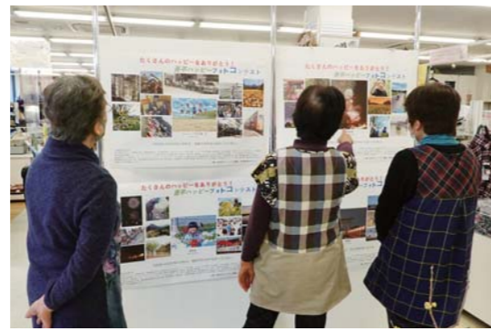
魅力あふれる吾平の 写真で町を元気に

2月2日、アグリパークかのやで「豆まき」が行われました。これは、JA鹿児島きもつきが組合員や地域住民に対し、安心安全な地元産の食材で免疫力を高めてもらい、地域を元気づけようと実施したものです。この日は、福豆2,000袋が準備され、中には農畜産物が当たる袋も混じっており、「鬼は外、コロナも外」という力強い掛け声とともにまかれました。