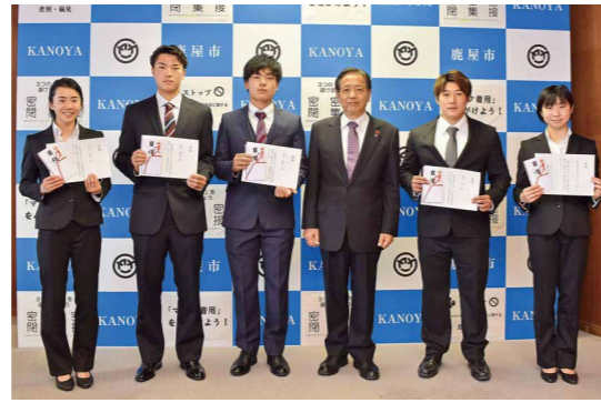
優秀な成績を収めた選手を称えて

2月15日～19日、市役所で「第6回鹿屋市障がい者絵画作品コンクールAct展」が開催されました。これは障がいのある人の作品が持つ可能性を広めることを目的に行われてきたもので、今回が最後の開催。計149点の応募の中から入選作品25点が展示されました。また、3月12日にはこれまで協賛をいただいた企業3社に感謝状が贈呈されました。