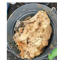
▶下水道管に詰まった油脂類

グリース阻集器にたまった油脂やゴミなどは、定期的に清掃してください。清掃を怠ると機能が低下し、油脂類が流れ出る原因となり下水道管を詰まらせます。また油などが下水道管に詰まってしまうと、営業に支障が出るだけでなく、管の清掃のために付近の居住者や事業所等に不便をかけることもあります。