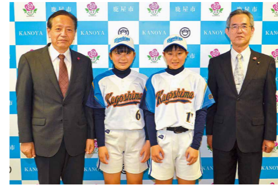
女子ソフトボールで大隅から日本一へ！

3月11日、「令和2年度鹿屋市スポーツ奨励金交付式」が行われました。これは、スポーツ振興と競技力向上を目的に、優秀な成績を収めた個人・団体に対して贈られるもの。今回交付されたのは、鹿屋体育大学の体操競技部、陸上競技部、カヌー部に所属する個人10人と、女子バレーボール部。式では参加した5人の選手に対し、奨励金と激励の言葉が贈られました。