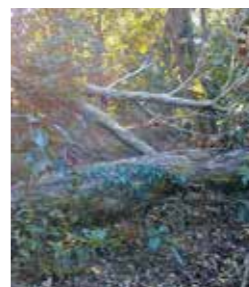
▲多くの倒木で荒地となった山道