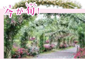
つるバラトンネル 春しか咲かないつるバラたちのトンネルは、春バラの満開の時期に見頃を迎えます。日本最大級の長さを誇り、木漏れ日のあふれる一押し絶景スポットです。

かのやばら園では、バラはもちろんのこと、四季折々の花々を楽しむことができます。昨年の春は新型コロナウイルス感染症の影響でばら祭りの中止や休園を余儀なくされましたが、今年は感染防止対策を行ったうえで「かのやばら祭り2021春」を開催しています。皆さんに楽しんでいただけるイベントも予定していますので、グラントオープン15周年を迎えたかのやばら園へのお越しを心からお待ちしています。