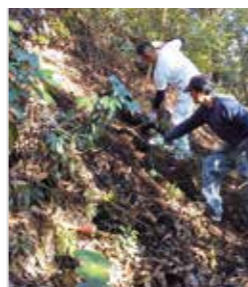
▲倒木を避けるため、急な斜面を整備