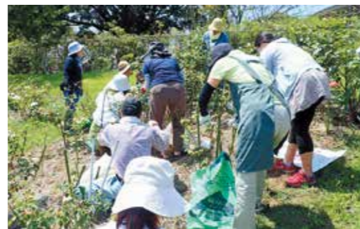
「ばらの栽培教室」を通して、「ばらのまちかのや」の機運醸成に取り組んでいます。