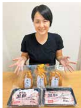
柴田亜衣 (アテネ五輪メダリスト)

鹿児島県産の肉は、口の中で溶けるような触感、鼻に抜ける上品な旨味。家庭でも簡単にこの味が楽しめるなんて驚きです。