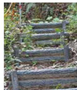
▲1つ12kgあったプラスチック製の階段