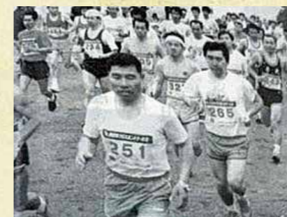
毎年開催されるクロスカントリー大会は輝北の一大イベントとして定着しています

丘陵や草原など、自然の地形を生かしたコースでレースをするスポーツのクロスカントリー。本市では昭和63年にその第1回目として「88南日本クロスカントリー大会きほく高原」が輝北町の上場高原で開催されました。 南九州初となる本格的なクロスカントリー大会ということもあり、800人を超す選手が参加。また、たくさんの応援者や家族連れなどでにぎわいました。九州各県をはじめ、遠くは神奈川県から参加した選手たちは、360度眺