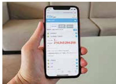
手続きごとに現在の待機人数と呼出番号を確認することができます