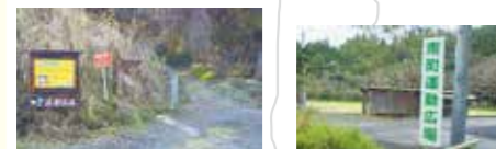
● トレッキングコース入口 ● 駐車場(南町運動広場)