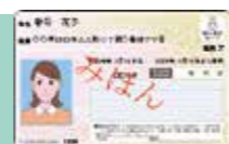
▲マイナンバーカード