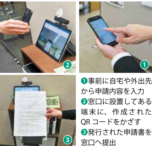
①事前に自宅や外出先から申請内容を入力 ②窓口を設置してある端末に、作成されたQRコードをかざす ③発行された申請書を窓口へ提出