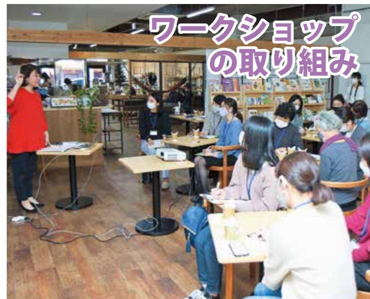
ワークショップの取り組み