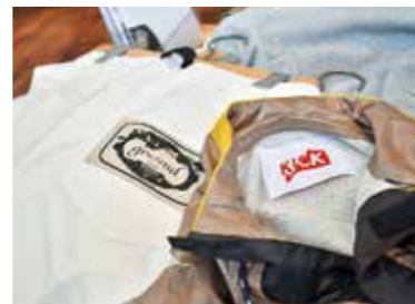
【右】自身のブランド「gru.rond」と男女兼用で着られるオリジナルブランド「KICK」の商品