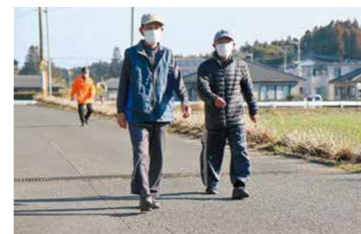
参加者は3グループほどに分かれて、自分に合ったコースを歩きます。

「本町自治会すこやか地域支援会」は、輝北町本町自治会の住民で構成され、健康増進を目的に月1回、ウォーキングやグラウンド・ゴルフ、ゲートボール教室等を行っています。同会が発足したのは平成18年。市の健康づくりに関する事業を活用したグループ活動として始めたのがきっかけでした。現在の会員は25人で、それぞれが無理のない範囲で活動をしています。また、毎月集まることで会員の健康状態を確認し合うことも重要な目的の一つです。発足以降、毎日ウォーキングを行うようになり、体調がよくなったという会員も多く、今後も健康のため、地域で協力し合いながら同会は歩み続けます。