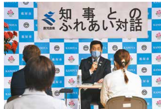
鹿屋の未来について 知事と熱く語り合う

4月27日、鹿屋に聖火がやってきました。鹿屋市内では、合計13人のランナーが聖火リレーに参加。7月23日から開催される「東京2020オリンピック競技大会」に向け、それぞれの想いを乗せて、聖火をつなぎました。