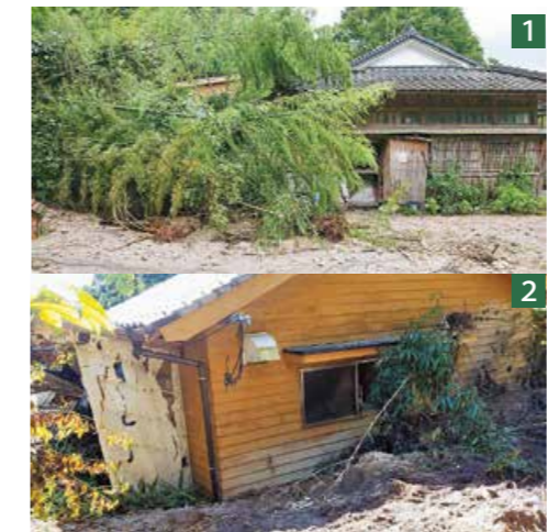
1 向かって左側の建物は土砂で完全に埋め尽くされた2 写真で見える部分は建物2階部分

前日に熊本の災害に関する番組をテレビで見ているばかりで、まさか自分たちがこのような体験をするとは思っていませんでした。災害は誰にでも起こり得ます。災害が起きたときどのような行動をとり、どこへ避難するかなどを考える必要があると思います。