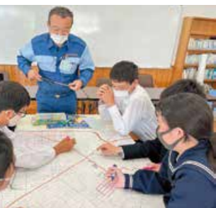
グループワークでの、危険箇所区域の確認