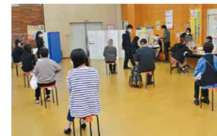
▲少人数で、待ち時間が大幅に短縮された集団健診の様子

短い時間で済み、苦しい検査はありません。 糖尿病・高血圧症・がんなど、長引く病気の 兆候やリスクを詳しく調べます。