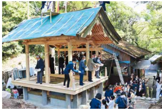
105年ぶりの 年貫神社本殿改築

4月18日、春日神社(南町)で本殿の改築工事に伴う上棟式が行われました。105年前に建てられた旧本殿は、老朽化のため、地元企業の小園建匠株式会社を中心に建て替えを計画。式には地域の住民など150人が参加し、昔ながらの手法による神事や餅まきなどが行われ、参加者の元気な声が飛び交いました。本殿は今年6月末に完成予定です。