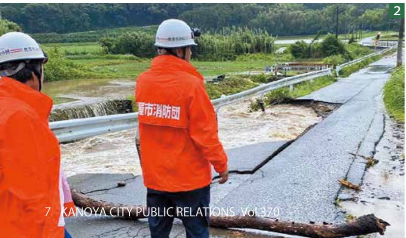
1 石垣の上まで水が浸かる状況の中、避難指示や状況確認作業を行った 2 大雨により道路が陥没。市内各地で計58箇所の路肩決壊があった

現場はパニック できる最善策を打ち続けた 今年で消防団歴36年目ですが、これまで経験したことのない災害でした。「橋に木が引っかかり、道路が冠水したので来てほしい」と連絡があり現場へ急行。現場は胸まで水が浸かる状況で、逃げ遅れた高齢者が2階から助けを呼ぶ声。その方は言いました。「あなたたちここにいてくれるの？」団服を着た人がそこに居て、姿が見えるだけで心強く安心するのだと思います。水が引くまでその場で見守るよう団員に頼みました。 水が引いた後も休む間もなく様々な作業を行い、ひと段落した時はもう19時過ぎ。朝から作業に従事した団員の疲労はピークで、誰一人話せないほど疲弊している様子は今でも忘れることができません。 水害で水の恐ろしさを知りました。しかし一方で、この経験により、その後の台風で地域住民の避難が早く、地域の意識が変わりました。昨年のことを忘れず、今年も早めの避難や自主的な防災に努めてほしいです。