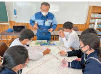
グループワークでの、危険箇所区域の確認