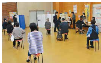
▲少人数で、待ち時間が大幅に短縮された集団健診の様子

短い時間で済み、苦しい検査はありません。 糖尿病・高血圧症・がんなど、長引く病気の 兆候やリスクを詳しく調べます。