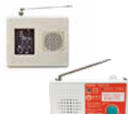
▲防災行政無線 ・防災ラジオ