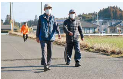
参加者は3グループほどに分かれて、自分に合ったコースを歩きます。