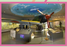
鹿屋航空基地 史料館