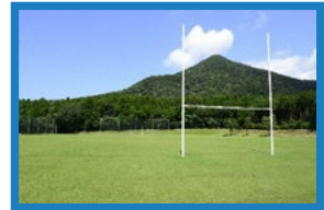
市民いこいの森運動広場 ラグビー等競技場