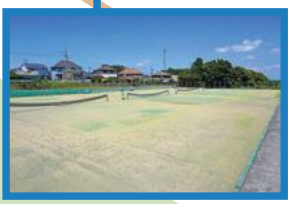
西原健康運動公園 テニス場