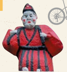
中津神社の田の神像