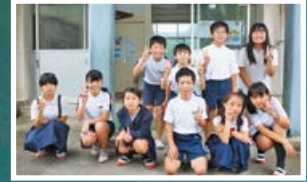
▲5・6年生のみなさん