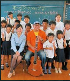
▲歌づくりワークショップの様子

私たちの学校には、校歌とは別に「高限が大好きだ」というオリジナルソングがあります。この曲はシンガーソングライターやアナウンサーの方と一緒に5年前に作りました。高限地域のいいところを全校児童と一緒に考え、出てきた言葉を歌詞につなぎ、作曲をしました。学校だけではなく、地域行事でもこの曲を歌う機会がたくさんあります。大好きなこの曲をこれからも大切に歌い続けたいと思います。