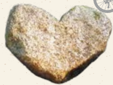
おしどりの滝ハート石