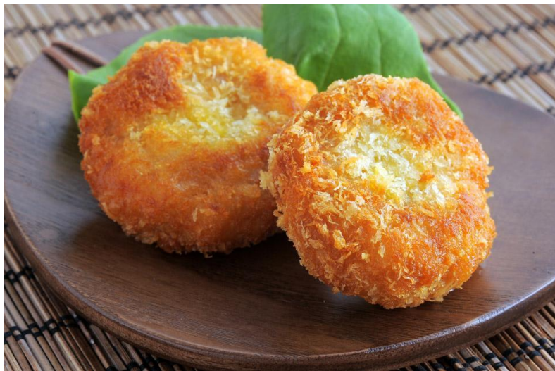
トーツマン・クン