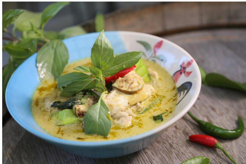
グリーンカレー（豚、鳥）