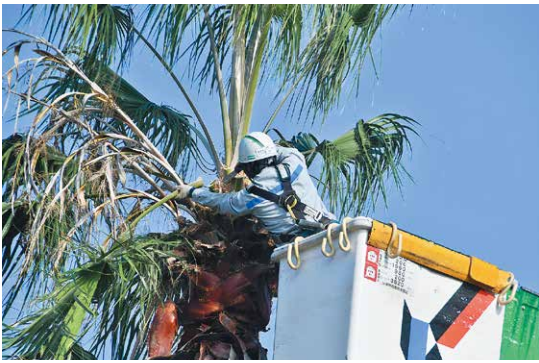
樹木をせん定・伐採 きれいな姿に

10月15日、市役所北側駐車場と第一鹿屋中学校で株式会社九電工と市内の企業による樹木のせん定・伐採作業が行われました。これは地域貢献の一環として毎年実施されているボランティア活動。今回は11社64人が参加し、高所作業車を使って市役所前のヤシの木のせん定を行ったほか、第一鹿屋中学校では校内から道路へ伸びる樹木の伐採が行われました。