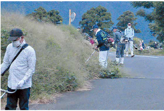
交通安全と日頃の感謝を込めて

10月9日、畜産環境センター（祇川町）周辺でボランティア清掃が行われました。これは、同センターを利用している養豚農家等が交通安全と日頃の感謝の気持ちを込めて毎年夏と秋に実施しているもの。秋晴れの中32人が参加し、同センター南側の農道約600m区間の伸びた雑草を払い、きれいな見通しの良い道となりました。