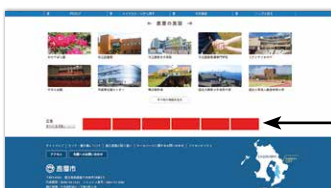
バナー掲載位置(市ホームページ下部)

問 市政策推進課 Tel 0994-31-1123 〒893-8501 鹿屋市共栄町20-1