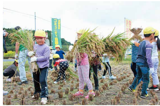
大きく育った稲穂を刈り取る

10月9日、畜産環境センター（祇川町）周辺でボランティア清掃が行われました。これは、同センターを利用している養豚農家等が交通安全と日頃の感謝の気持ちを込めて毎年夏と秋に実施しているもの。秋晴れの中32人が参加し、同センター南側の農道約600m区間の伸びた雑草を払い、きれいな見通しの良い道となりました。