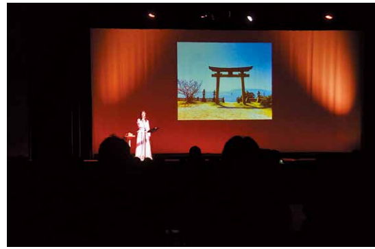
神話の世界を 堪能する一夜

10月15日、市役所北側駐車場と第一鹿屋中学校で株式会社九電工と市内の企業による樹木のせん定・伐採作業が行われました。これは地域貢献の一環として毎年実施されているボランティア活動。今回は11社64人が参加し、高所作業車を使って市役所前のヤシの木のせん定を行ったほか、第一鹿屋中学校では校内から道路へ伸びる樹木の伐採が行われました。