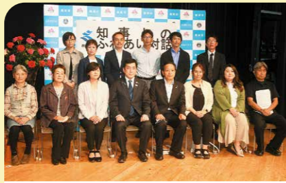
4月 知事とのふれあい対話 リナシティで塩田知事とのふれあい対話が開催され、子育て環境の整備や水産業への支援など率直な意見交換が行われました。