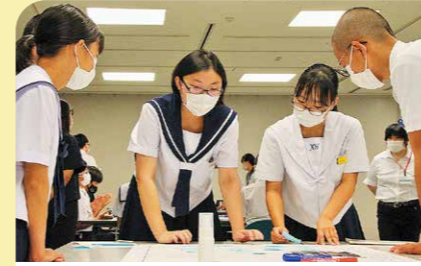
8月 鹿屋子どもサミット いじめの解決に向けて、各学校での取り組みやワークショップなどを行い、学校の垣根を越えた意見交換が行われました。