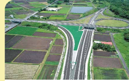
7月 東九州自動車道志布志IC～鹿屋串良JCT開通 東九州自動車道の新区間19.2kmが開通し、大隅地域間のアクセスが向上しました。