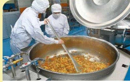
9月 北部学校給食センターが稼働 学校給食の充実と安全性の向上を目指し、最新の技術を取り入れた北部学校給食センターが稼働。市内11校への提供が始まりました。