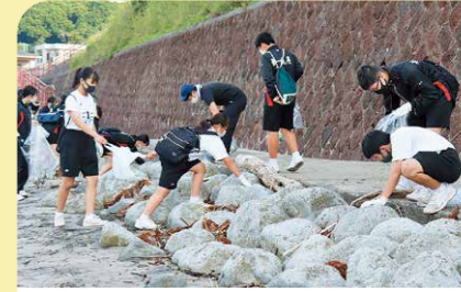
6月 錦江湾クリーンアップ作戦 高須・浜田海岸周辺で4年ぶりとなる錦江湾クリーンアップ作戦が行われ、町内会や学生およそ500人により清掃が行われました。