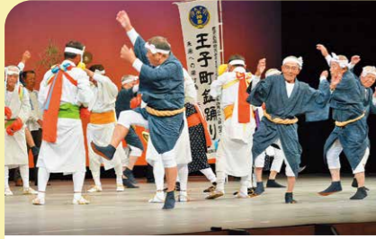
11月 九州地区民俗芸能大会 九州・沖縄に伝承されている民俗芸能大会が鹿屋市で開催され、本市からは王子町鉦踊りと串良町山宮神社春祭りが出場しました。