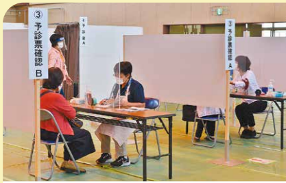
5月 新型コロナワクチン接種開始 本市でも医療従事者や65歳以上の高齢者など、優先的に接種が必要な人から段階的にワクチン接種が開始されました。