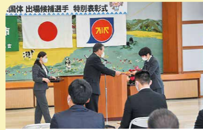
3月 かごしま国体出場候補選手へ特別表彰 延期となった同大会の出場候補選手のこれまでの努力をたたえ、また2023年の大会実施に向けさらなる活躍を祈念しました。