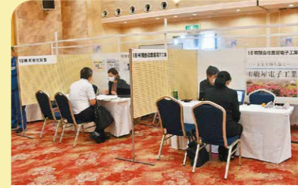
7月 合同就職面談会の開催 地元企業の雇用確保や若者等の市内就職・定住を目的に合同就職面談会が行われ、市内の企業40社が参加しました。