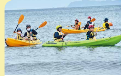
7月 かのやマリンフェスタ2021 高須・浜田海岸で3年ぶりに開催。バナナポートやスタンドアップパドルボードなど、800人の参加者がマリンスポーツを楽しみました。