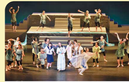
2月 高校生ミュージカル「ヒメとヒコ～ある王の物語～」の上演 今年で14回目を迎えた公演では、郷土芸能を組み込んだ新曲なども披露されました。