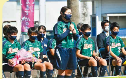
10月 MORI ALL WAVE KANOYA がリーグ初参戦で初優勝 日本女子プロソフトボールリーグ3部に初参戦した同チームが優勝の快挙を成し遂げました。