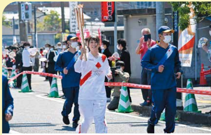
4月 東京2020オリンピック聖火リレー 7月から開催される東京2020オリンピック競技大会に向け、鹿屋にも聖火が到着。大勢の観客が沿道で声援を贈りました。