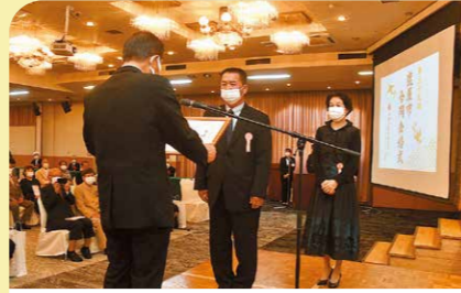
10月 第39回合同金婚式 結婚して50年目を迎えた夫婦を祝う合同金婚式が市内のホテルで開催されました。参加した51組の夫婦は50年の絆を共に祝いました。