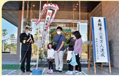
3月 鹿屋航空基地史料館来館 200 万人 平成5年にオープンした同史料館が開館 32 年余りを経て来館者数 200 万人を達成し、記念セレモニーが行われました。