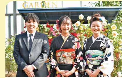
1月 鹿屋市成人式オンライン開催 新型コロナウイルス感染症の影響で式典に代わり、オンラインを利用して式辞などを動画配信する成人式が行われました。