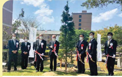
9月 鹿屋体育大学開学40周年記念 昭和56年に国内初の国立体育系単科大学として開学した鹿屋体育大学が40周年を迎え、式典や植樹等の記念行事が行われました。