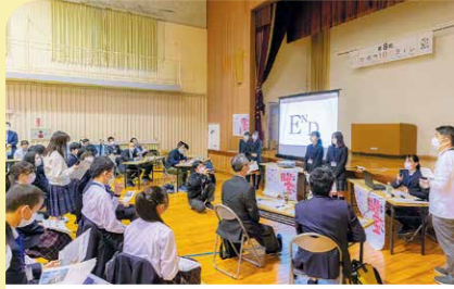
11月 第8回かのや100チャレ 市が抱える様々な課題の解決策を首都圏や地元の中高生に提案してもらう政策アイデアコンテストが行われました。