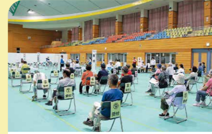
6月 串良平和アリーナで集団接種開始 幅広い世代の人に迅速なワクチン接種を行うため、大規模会場でのワクチン接種がスタートしました。