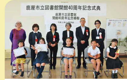
5月 市立図書館開館40周年記念式典 昭和56年に開館した市立図書館は今年で40周年を迎えました。式典では記念植樹などが行われ、今後の発展を祈りました。