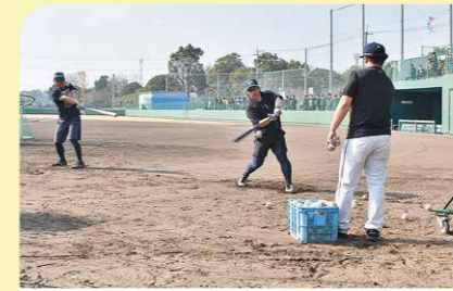
1月 プロ野球選手が平和公園で自主トレ ソフトバンクホークスで活躍する甲斐拓也選手など4人が平和公園野球場で自主トレを行い、多くの野球ファンが訪れました。