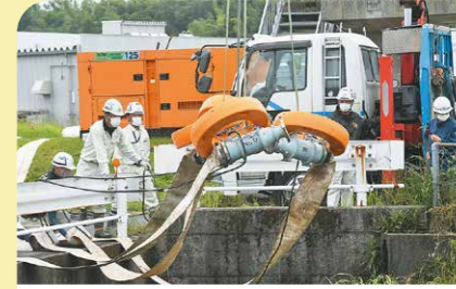
5月 新川町排水ポンプ設置訓練 令和2年7月災害を踏まえて、今季の梅雨時期及び台風等による浸水被害に備えて、新川町で排水ポンプの設置訓練が行われました。