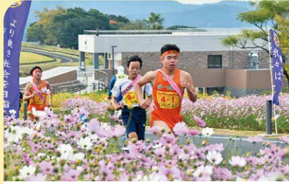
11月 第12回かのやローズヒル駅伝大会 校区別に選抜された13チームの選手が霧島ヶ丘公園内のコース13区間21.2kmを競い、総合優勝に西原台小学校が輝きました。