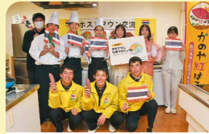
2月 ホストタウンサミット2021 鹿屋農高・中央高校生が地元食材を使用したタイ王国へのおもてなし料理を作り、鹿屋の魅力をオンラインで発信しました。