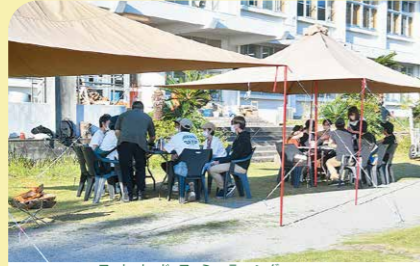
10月 OUTDOOR Meeting2021 流行りのアウトドアで男女の出会いを応援するイベントが開催され、参加者は最高のロケーションと様々な活動を楽しみました。