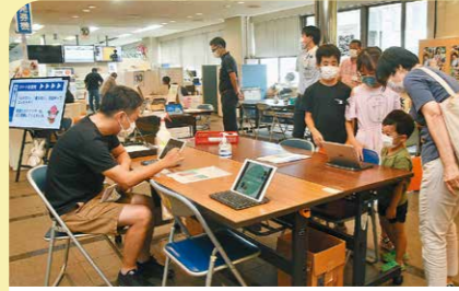
10月 デジタルの日創設記念イベント 今年国が創設したデジタルの日に合わせて市で記念イベントが行われ、多くの人々がデジタルの便利さに触れました。