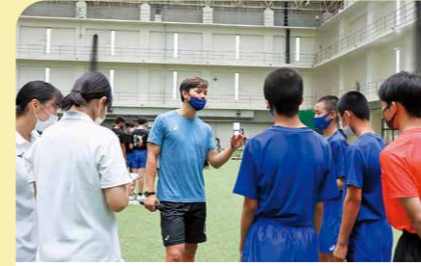
8月 男子プロ選手によるバレー教室 東京2020オリンピックに出場した西田有志選手など3人を招いて中学生対象のバレーボール教室が行われました。