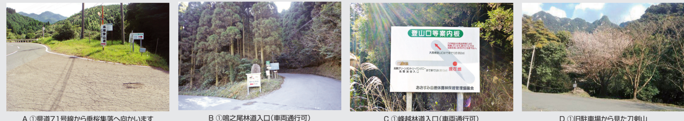
A ① 県道71号線から垂桜集落へ向かいます B ① 鳴之尾林道入口(車両通行可) C ① 峰越林道入口(車両通行可) D ① 旧駐車場から見た刀剣山