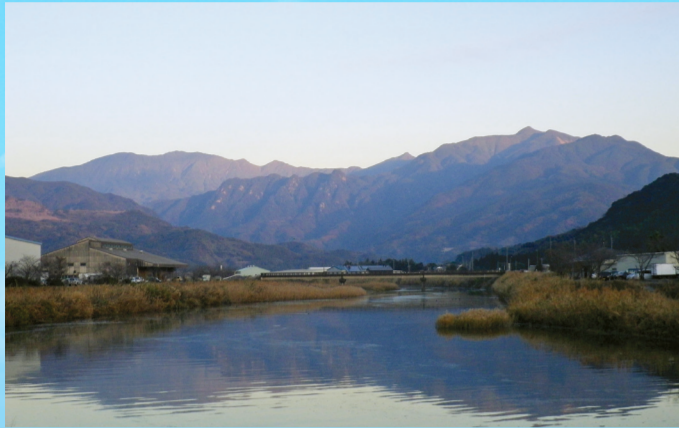
垂水市から望む高隈連山