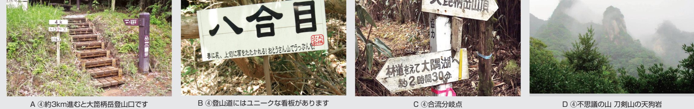
A ④ 約3km進むと大隅柄岳登山口です B ④ 登山道にはユニークな看板があります C ④ 合流分岐点 D ④ 不思議の山 刀剣山の天狗岩