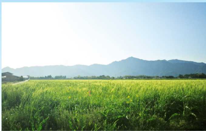
鹿屋市東原町から望む高隈連山