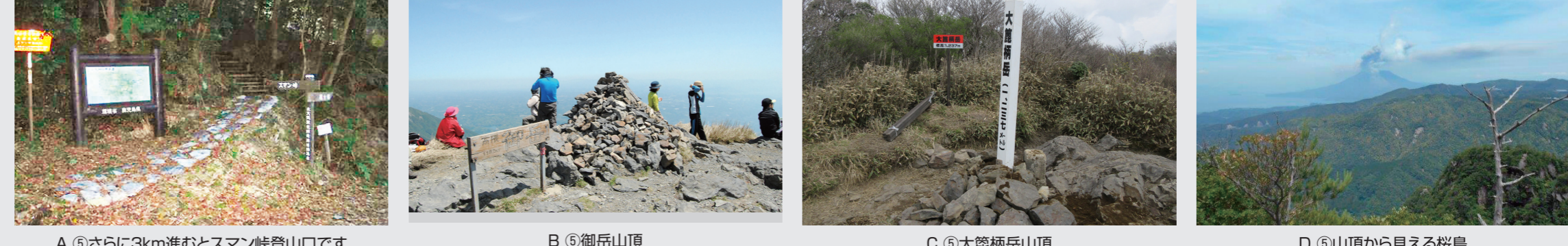
A ⑤ さらに3km進むとスマン峠登山口です(猿ヶ城林道分岐まで車両通行可) B ⑤ 御岳山頂 C ⑤ 大隅柄岳山頂 D ⑤ 山頂から見える桜島