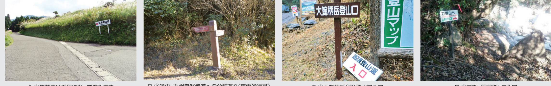
A ② 集落内は看板に沿って進みます B ② 途中、九州自然歩道への分岐あり(車両通行可) C ② 大隅柄岳(沢)登山口入口 D ② ますげ淵下登山口入口