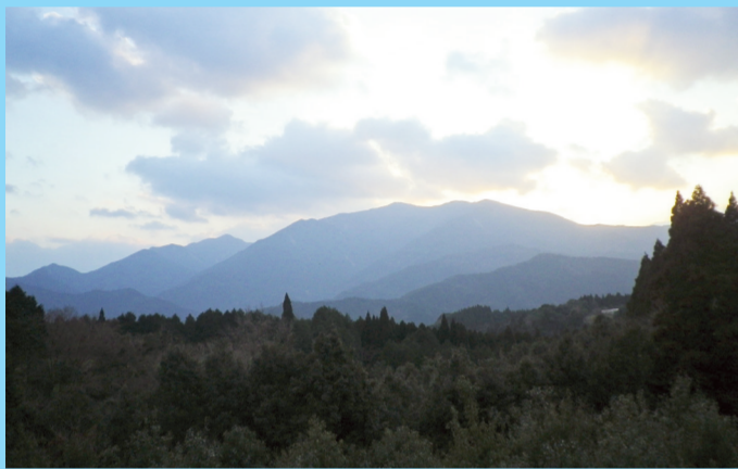
大隅湖方向から望む高隈連山