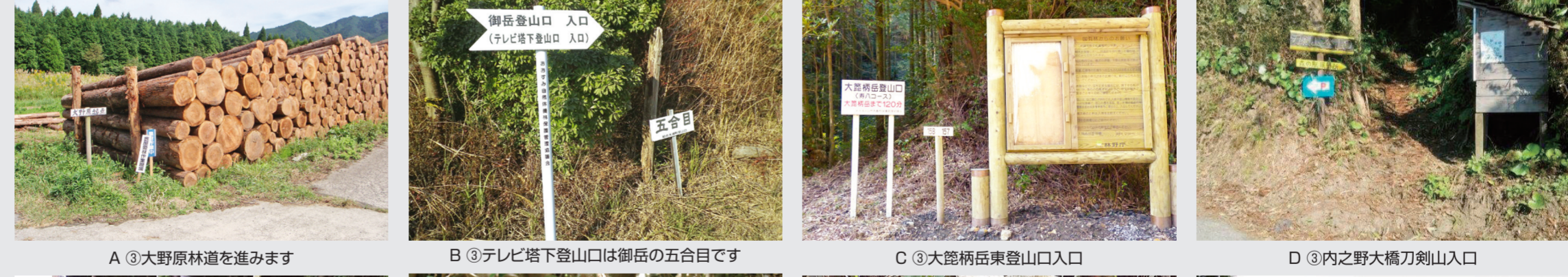
A ③ 大野原林道を進みます B ③ テレビ塔下登山口は御岳の五合目です C ③ 大隅柄岳東登山口入口 D ③ 内之野大橋刀剣山入口