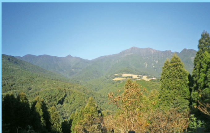
鳴之尾林道から望む高隈連山