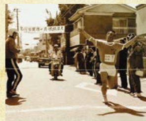
岡崎交差点付近のゴールの様子。(昭和51年)

し、山下から平瀬へ北上し、細山田校区を通過して南下、辰喰から白山神社を抜けて下原池公園を過ぎ、ゴールは串良総合支所前という13区間23.4km。多くの観戦者の声援を浴びながら各チームの選手が沿線を駆け抜ける町内一周駅伝は毎年恒例行事として冬の串良の名物詩となっています。 昨年はコロナ禍により大会中止を余儀なくされましたが、今回で64回を迎える大会は2月6日(日)に実施予定です。自慢の健脚を競う伝統のタスキがつかねがれまので、市民の皆さんの温かい応援をお願いします。