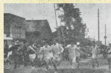
昭和36年の第3回大会スタートの様子。まだ道路は舗装されておらず、木造の建物が立ち並ぶなど、昔の街並みが時代を感じさせます。

参加は小学生・中学生・一般にクラス分けされ、寒空の治道で健脚を競います。これまでに道路交差通事から数回のコース変更がありました。現在のコースは串良ふれあいセンターからスタート