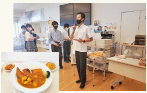
▲湘南学園が考案 & 提供したメニュー「かのやカンパチのカツカレー」「かのや紅はるかのスイートポテト」

本校は第1回から「かのや100チャレ」に参加しています。参加した生徒と学生食堂が協働し、鹿屋市の食材を使用した「かのやメニュー」を考案・提供しています。用意した数量がすぐに完売するなど、食べた人からはとても好評でした。今後も「かのやメニュー」の提供を続けていく予定です。