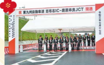
鹿屋串良JCT～志布志IC間の開通で、大隅の交通アクセスが向上しました。