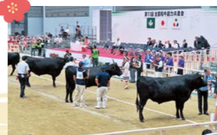
10月の「全国和牛能力共進会」では鹿屋島県の団体2連覇が期待されます。