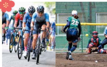
市内のプロスポーツチームは今年も新たな舞台・体制で全国に挑みます。