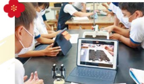
市内の全ての小・中学校へタブレットを配付し授業で活用しています。