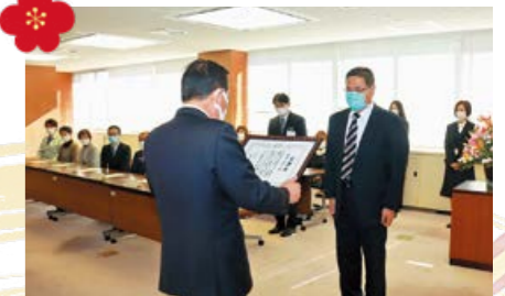
医療関係者等の協力により、ワクチン接種がスムーズに進みました。