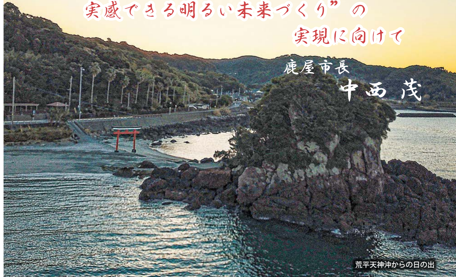
荒平天神沖からの日の出