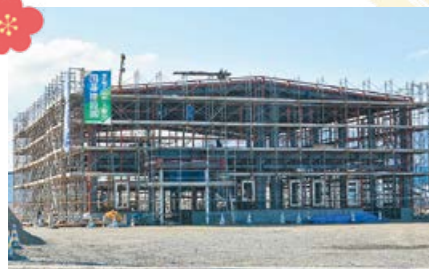
誘致企業の工場増設が完了予定であり、新たな雇用の期待されます。