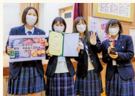
最優秀賞を獲得したオオカミと3匹のこひつじ チーム

最優秀チームの発表 中学1年生から同じバレー部に所属するメンバーで出場した「オオカミと3匹のこひつじ」チーム。「世界の料理をもっと知ろう」と題し、国際協力機構(JICA)が運営している食堂「J's Cafe」を参考に、異文化理解を深められるカフェを立案しました。地元で採れた規格外食材を使用することによる地産地消の推奨やフードロスの削減、宗教上の理由などで特定の食材が食べられない人への配慮を行うことで、多文化の人材が集う交流拠点として整備。文化間の摩擦を減らすことにより、様々な人々が暮らしやすくなることを目指し、見事最優秀賞に輝きました。