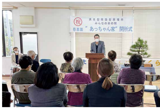
としちゃん家・あっちゃん家開所

11月30日、田淵町で「としちゃん家・あっちゃん家」の開所式が行われました。としちゃん家では、介護予防体操等を実施しており、あっちゃん家は、市内で2例目となる多世代が自由に交流できる場所として、それぞれ元病院や民家を利用して開所。地域の方々がいつでも誰でも集える「みんなの茶の間」として今後は地域の交流拠点としての利用が期待されます。