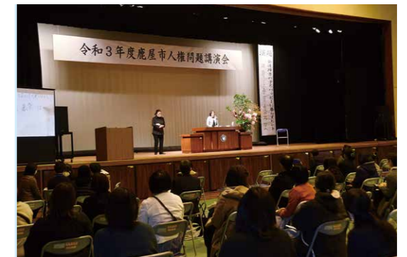
人権問題を正しく 理解するために

12月5日、百引多目的グラウンドでMORI ALL WAVE KANOYAと輝北地区の3つのスポーツ少年団が交流を行いました。これは同チームの地域貢献活動の一環で、輝北軟式野球スポーツ少年団が企画したものです。キャッチボールやバッティングなどの技術指導に加え、ウォーミングアップの方法を教えてくださいなど、児童は終始笑顔で交流を楽しみました。