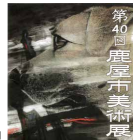
▶第39回鹿屋市美術展大賞 千足 みえ氏「今、生きる 2021-III」