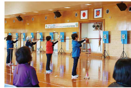
かごしま国体に向け県内初の吹矢大会

11月28日、吾平山陵公園で「吾平山上陵の四季を楽しむお茶会」が開催されました。これは山上陵の美しい自然と神々しさを知ってもらうことを目的に、美里吾平コミュニティ協議会が開いたもの。当日は、鹿屋女子高茶道部の協力や雅楽演奏、二ライスタジオによる創作芸能も行われ、訪れた参拝者は典雅な雰囲気の中、深まる秋を楽しみました。