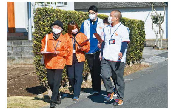
高齢者の安心安全のために

11月27日、鹿屋市武道館で「第1回鹿児島県スポーツウエルネス吹矢選手権大会」が行われました。本大会は来年に開催予定の「燃ゆる感動かごしま国体」に向けて県内で初開催されたもの。大会には県内の有段者95人が参加し、会場には競技に集中した参加者の吹矢の発射音だけが響きわたるなど緊張感のある空気に包まれました。