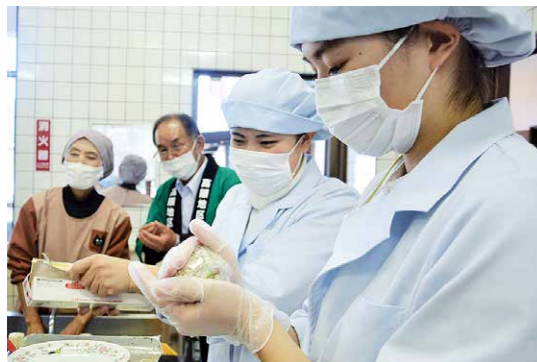
アイデアあふれる 高隈米のおむすび

12月11日、高隈地区交流促進センターで「高隈米おむすびコンテスト」が行われました。これは高隈地区コミュニティ協議会が11月に鹿児島女子短期大学と結んだ連携協定による第1弾のコラボイベント。コンテストでは様々なアイデアあふれるおむすびが紹介されました。今回出品されたおむすびは、高隈の飲食店2店舗で期間限定販売を予定しています。