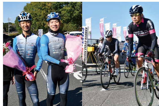
熱いレースと 新たな旅立ち

12月11日、高隈地区交流促進センターで「高隈米おむすびコンテスト」が行われました。これは高隈地区コミュニティ協議会が11月に鹿児島女子短期大学と結んだ連携協定による第1弾のコラボイベント。コンテストでは様々なアイデアあふれるおむすびが紹介されました。今回出品されたおむすびは、高隈の飲食店2店舗で期間限定販売を予定しています。