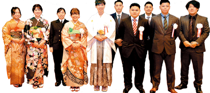
令和4年鹿屋市成人式実行委員会の皆さん