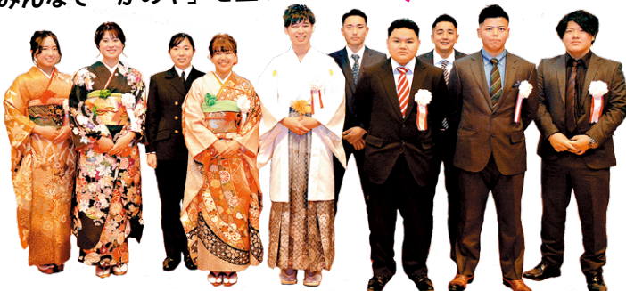
令和4年鹿屋市成人式実行委員会の皆さん