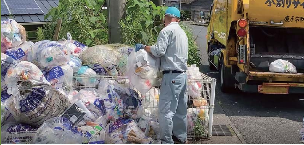
▲ごみの分別が不十分で、ごみがあふれている様子