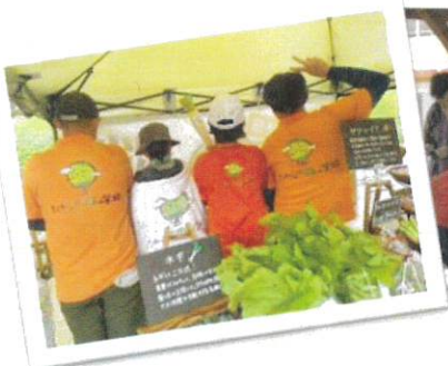
ど〜んと鹿児島島出演