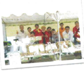
悠久の森ウォーキング大会出店