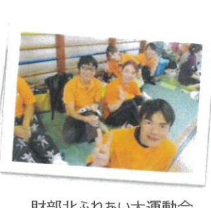
財部北ふれあい大運動会