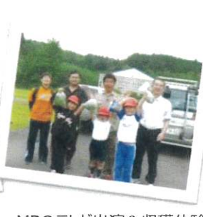
MBC テレビ出演 & 収穫体験