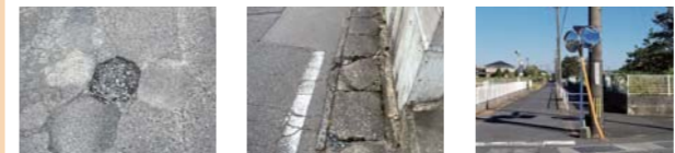
▲道路の異常箇所の例(穴ぼこ、蓋板割れ、ロードミラー倒れ)