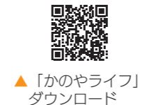
▲「かのやライフ」ダウンロード