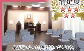
※斎場によって会場に違いがあります。