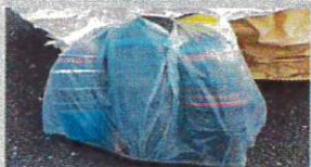
重ねて袋にまとめる