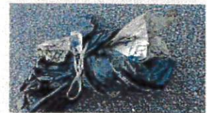
違う種類を重ねる