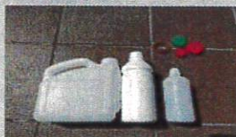
キャップ・ラベルを取り外し 中を洗う