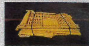
すべてのカゴ類、 切断し、結束