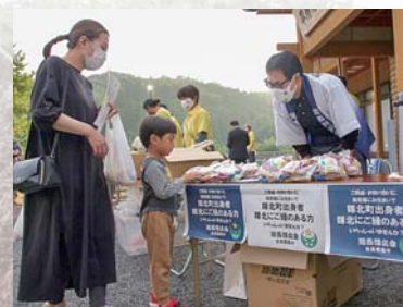
▲地元産の野菜やお米などの無料配布も先着で行われました。

5月28日～6月4日、平房活性化センターで「ひらぼうほたるの里ほたる祭り」が開催されました。輝北ダムの下流であるこの場所では、ゲンジボタル・ヒメボタル・ヘイケボタルの3種類のホタルを見ることができます。28日には、地元有志団体「ひらぼうほたる飛ばせ隊」による地元特産品などが当たるじゃんけん大会や、マスコットキャラクター「ひらちゃん・ぼうちゃん」の飛行式などのオープニングイベントを実施。日没後は周囲を散策し、訪れた参加者は夏の風物詩が灯す幻想的な光のイルミネーションを楽しんでいました。