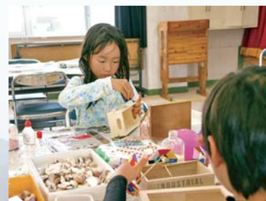
▲高須地区学習センターでは貝殻や流木などを使ったクラフト体験も実施

7月24日、高須・浜田海水浴場で「かのやマリンフェスタ2022」が開催されました。本イベントは、様々な体験などを通して海の魅力を知ってもらおうと鹿屋体育大学や鹿屋海洋スポーツクラブ、地元町内会などが協力して行っているもの。当日は800人以上が会場を訪れ、スタンドアップパドルボードやバナナボート、ウインドサーフィンなどの普段体験できないマリンスポーツを楽しみました。また、綱引き大会やビーチサンダルとばし大会といった参加型イベントでは、白熱した勝負が見られ大人も子どもも真夏日の1日を楽しんでいました。