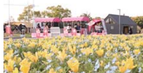
▲かのやばら園ホームページ