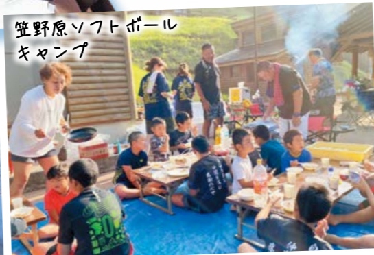
笠野原ソフトボール キャンプ