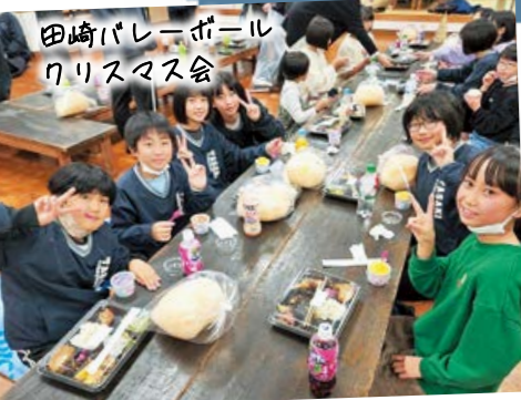
田崎バレーボール クリスマス会

頑張る子どもたち、教える指導者、支える保護者。スポーツ少年団には多くの人が携わっています。そんな人たちにスポーツ少年団の楽しみや魅力を聞きました。