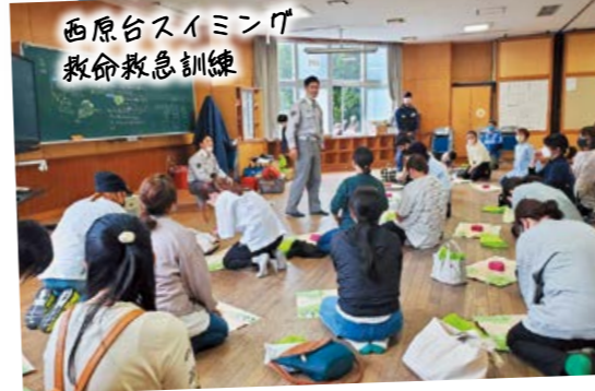
西原台スイミング 救命救急訓練