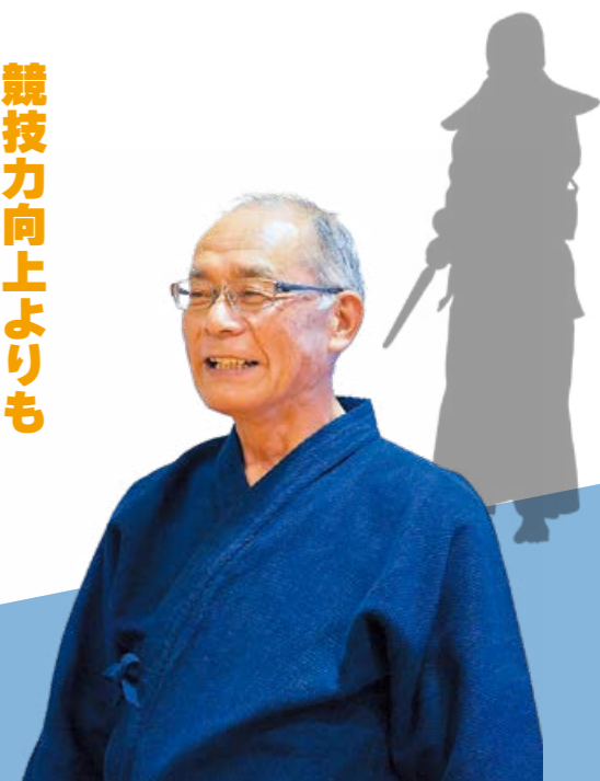
鹿屋警察署直心館剣道 スポーツ少年団 指導者

競技力向上よりも 子どもの健全育成を 私は、現役の警察官の頃から子どもたちへ剣道の指導を行っています。親御さんから「うちの子どもは運動神経があまり良くなくて…」といった言葉をよく耳にします。しかし、子どもはとても大きなポテンシャルを秘めているので、まずは何事も「させてみる」ことが大切。集中しているときに目の色が変わる様子は、大人でもびくつきさせられます。一方で、一生懸命してしまいう子どもだからこそ、知らず知らずのうちに体を痛めたり、熱中症になったりしてしまいます。子どもたちの気持ちに体谅や体力がついていかないこともあるため、無理をさせないように指導者として気を付けています。