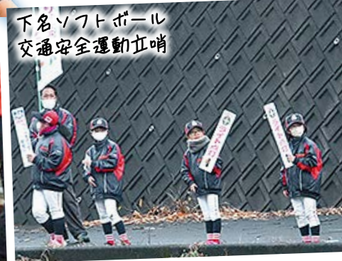
下名ソフトボール 交通安全運動立哨