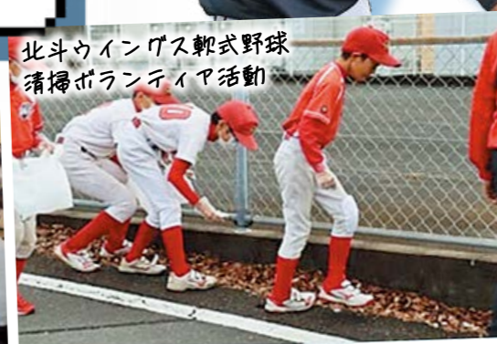
北斗ウイングス軟式野球 清掃ボランティア活動