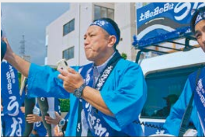
▲「土用のうしの日問題篇」の1シーン。気持ちの入った表情やセリフに注目です。