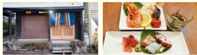
居酒屋 お魚々 (おとと)

〒893-0004 鹿屋市朝日町1-4 ☎0994-41-1144 店休日 日曜日(要相談) 営業時間 18:30~24:00