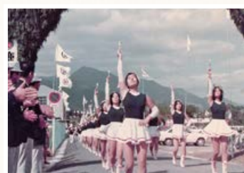
▲市体育館前を通過するパレード