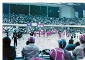
▲バレーボール主会場の市体育館