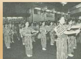
▲「ばか踊り」が初めて披露されたのは昭和38年。御神幸行列に続いて踊りが加わり、祭りをさらに盛り上げるようになりました。

当時から神輿やトラックなどを飾り付けた「山車」による御神幸行列が行われていたが、現在のような踊りは行われていませんでした。昭和30年代半ば、徳島県の「阿波踊り」を参考にした踊りが取り入れられたことで、名称を「かのや夏祭り」に改めました。