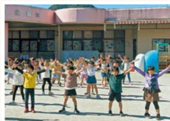
◀ 「国体ダンス」リレー動画の作成