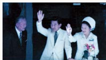
▲来鹿された当時の皇太子御夫妻

昭和47(1972)年に鹿児島県で開催された「第27回国民体育大会(太陽国体)」の様子をご紹介します