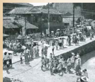
▲昭和35年の北田町での祇園祭の様子。祇園祭は県内では親しみを込め「おぎおんさあ」とも呼ぶ。

今年4年ぶりに開催された鹿屋の夏の風物詩「かのや夏祭り」。その前身にあたる「祇園祭」は、戦時中に途絶えていた時期もあり、いつから行われていたか定かではありませんが、戦後の昭和25年頃から青年団によって夏祭りとして再開。その後、鹿屋商工会議所と鹿屋市の共催で復活しています。