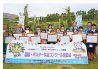
◀ 図画・ポスター作品コンクールの実施