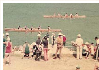
▲大隅湖での漕艇(ボート)競技