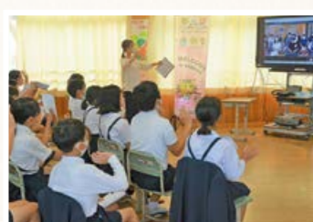
◀ 次回の開催地である佐賀県の富士小学校と交流