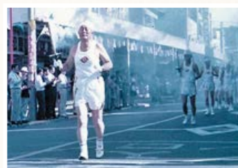
▲本町を通過する23人の炬火リレー隊