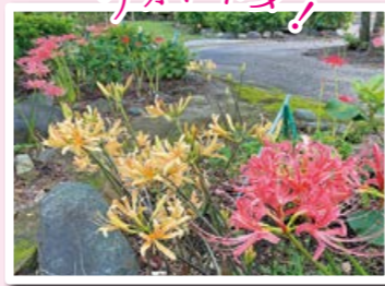
ばら園内の彼岸花

9月の初旬から中旬にかけて見頃を迎える彼岸花。赤色の彼岸花のほか、淡い赤や黄色の変り種も、数は少ないですが来園者の目を楽しませています。