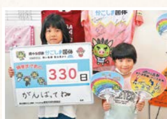
◀ 国体カウントダウン応援メッセージ