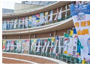
◀ 市内小・中・高生が学校応援のぼり旗を作成

市国体推進室が行ったかごしま国体・大会に向けた気運醸成のための取り組みの一部を紹介