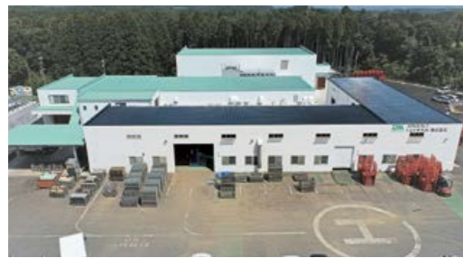
トミチ九州 株式会社

コロナを機に生活スタイルが変わってきています。食においても冷凍食品の売上が以前より伸びており、食の簡便化が進みます。消費者が口にするまでに、これまで以上の加工が必要になってくると考えています。今後は、消費者のニーズに沿った加工度の高い商品づくりを目指して頑張っていきます。