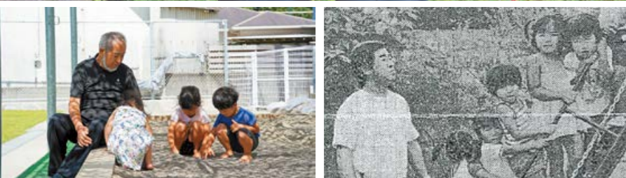
【左】園庭での様子。子どもには人とのつながりを大切にしてほしいため、物で遊ぶよりも友達や親とたくさん触れ合いながら遊んでほしいと語る。 【右】昭和56年の様子。当時、鹿児島県児童家庭課が認知していた保育資格を有する男性は県内に2人だけだった。 (南日本新聞昭和56年9月27日掲載)