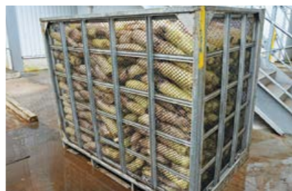
▲約1tの大根が入る鉄コン。土が付いたまま集荷を行う。