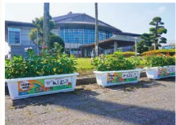
◀ 「花いっぱい運動」で会場にプランター設置