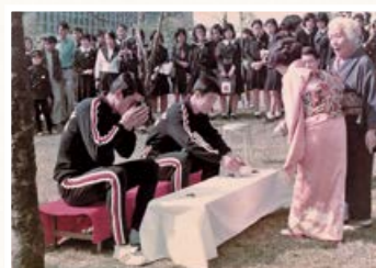
▲お茶のおもてなしを受ける選手たち